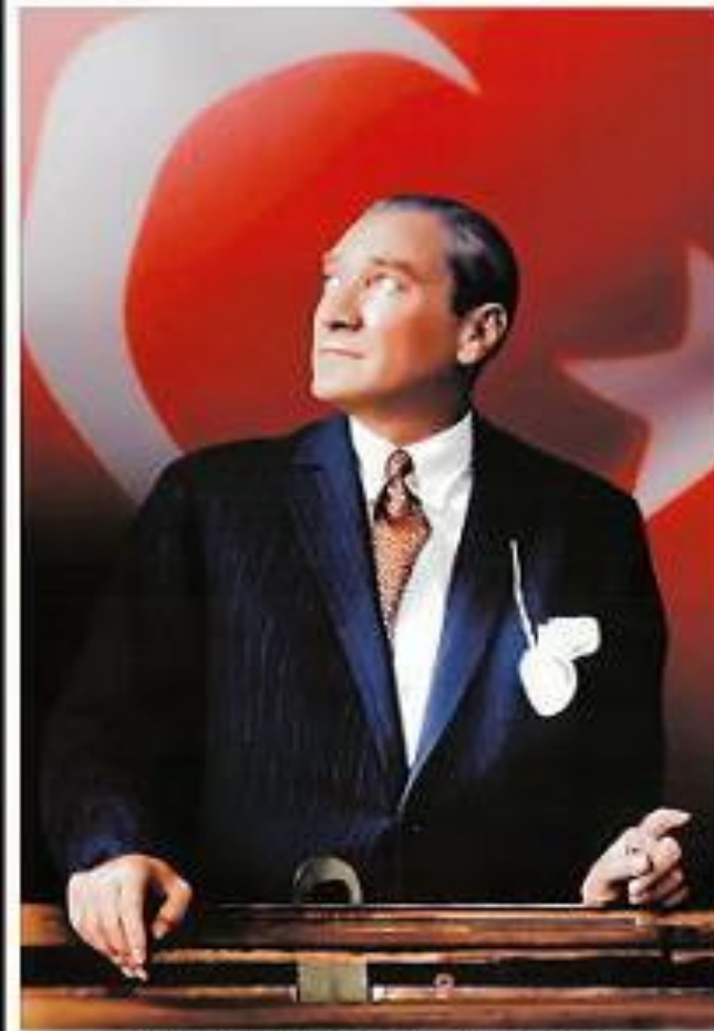
MUSTAFA KEMAL ATATÜRK 1881 - 1938

Değseler sen de şafaklar gibi ey jani hilal! Olur artık dökülen kollarım hep şifâ helal, Ebediyen sana yok, ısmı yok lahâtilid, Hakkıdır, hür yaşarım, bayrakçınam hürriyet; Hakkıdır, hâkî'nin tepesi, milletimin istiklal!